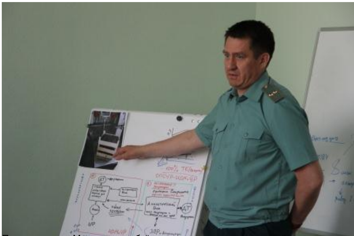
Беседа с залом в Московской областной таможне.